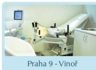
Praha 9 - Vinoř