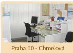
Praha 10 - Chmelová