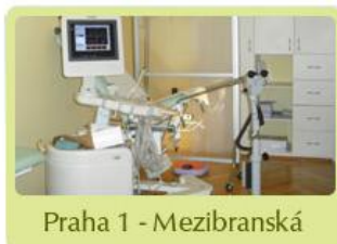
Praha 1 - Mezibranská